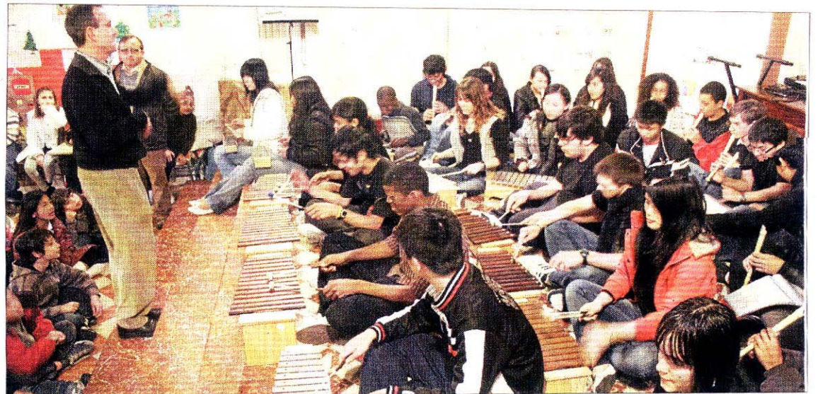
▲ Sant Felip Neri. Los juegos en la calle se anularon y se realizaron los talleres, conciertos y exposiciones solidarios en el centro.

Jornada de puertas abiertas en los colegios Cide, Marian Aguiló, Sant Felip Neri y Santa María donde además se instalaron mercadillos para recaudar fondos económicos para ayudar en diferentes proyectos