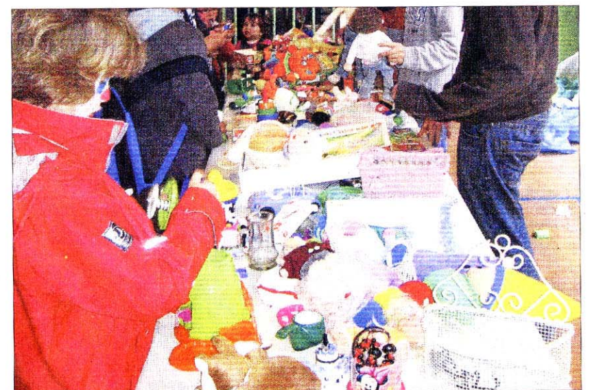
▲ Santa María. Juguetes en algunas mesas con motivo de la IV Fira Solidaria en favor de un colegio de Huajchilla, en Bolivia.

diferentes proyectos y apadrinamientos. En el colegio público Marian Aguiló, de Palma dentro de la semana cultural y jornada de puertas abiertas se expusieron varios trabajos y abrieron mercadillo solidario a beneficio de los proyectos en Nicaragua, coordinados por el Fons Mallorquí de Solidaritat. También el colegio Santa María organizó ayer su IV Fira Soli-