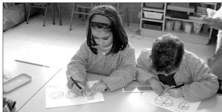
Les possibilitats eren moltes i variades.